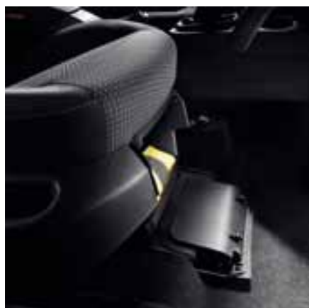
Вещевое отделение под сиденьем переднего пассажира