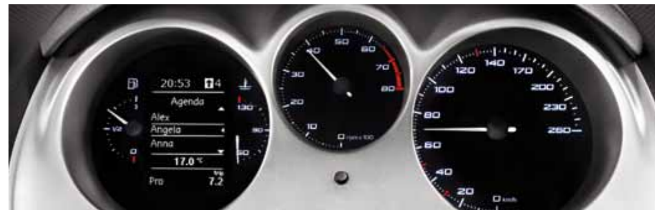
Интерфейс Bluetooth* с функцией выбора параметров и индикация рекомендуемой и включенной передачи.