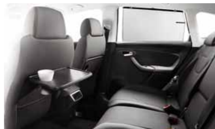
Откидные столики на спинках передних сидений (включены в пакет многофункциональный).