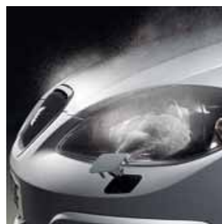
Омыватели фар (стандартное оборудование).