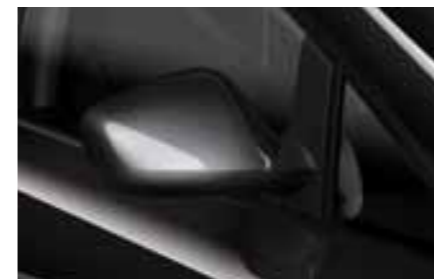
ЧЕРНЫЙ (Universo Black - L8L8) с эффектом металлик