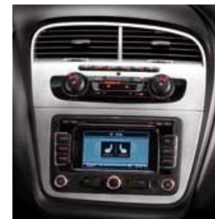
Передние сиденья с обогревом (стандартное оборудование)