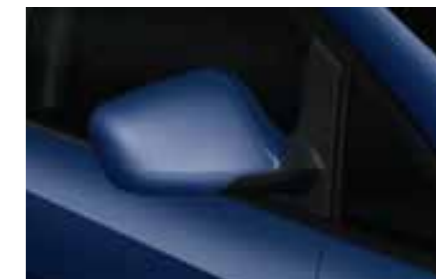
СИНИЙ (Ada Blue - 7N7N) с эффектом металлик