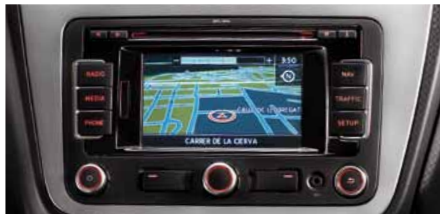
Мультимедиа SEAT Media 2.2, сенсорный экран и встроенный интерфейс Bluetooth*.