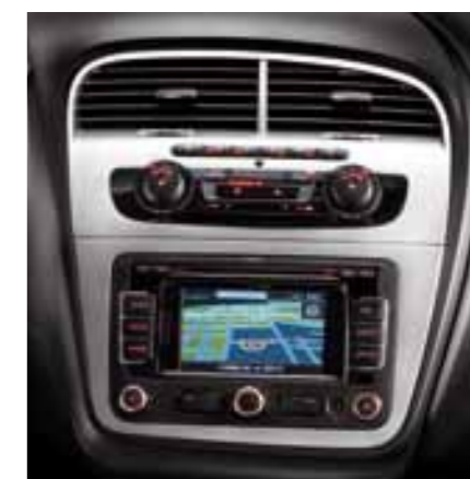
Медиа-система SEAT Media System 2.2 с сенсорным дисплеем и встроенным интерфейсом Bluetooth* (опциональное оборудование)