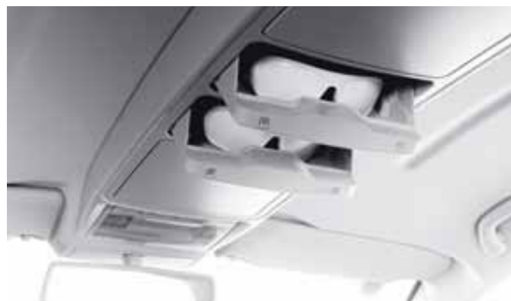
Отделение для хранения очков, на потолочной консоли (включено в пакет многофункциональный).