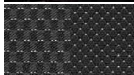
CN - Ткань "COSMOPOLITAN" черный/серый