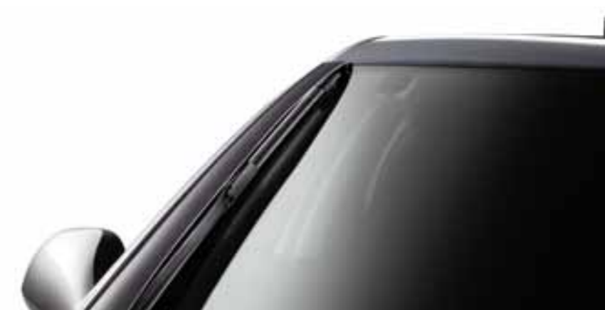
Стеклоочистители, интегрированные в вертикальные стойки ветрового стекла.