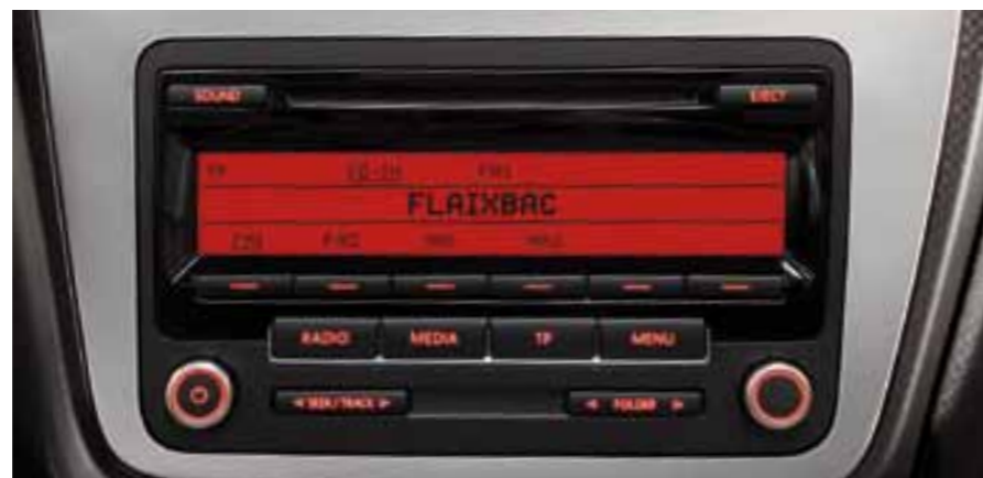
Аудиосистема SEAT Sound System 2.0 (Радиоприемник с CD/MP3/WMA-проигрывателем и кнопками управления на рулевом колесе + 8 динамиков + разъем AUX-in).