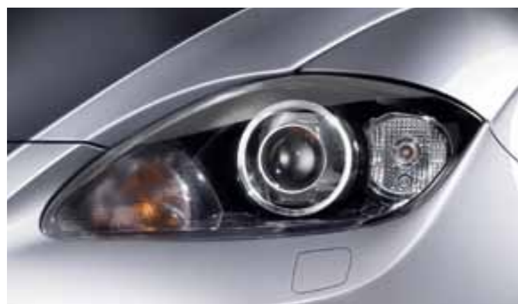
Биксеноновые фары с системой AFS (система адаптивного света фар) и системой дневных ходовых огней. (опциональное оборудование)