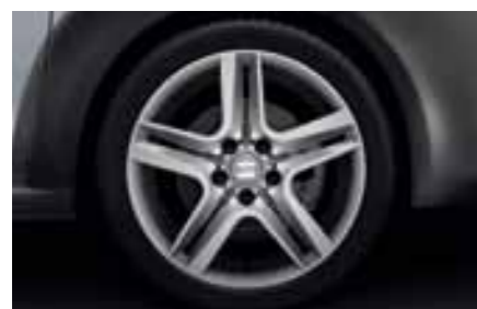
17" легкосплавный диск "Agra" (для версии с передним приводом 2WD)