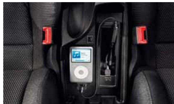
Оборудование для подключения iPod** и разъемы USB/AUX-in (CUP) для воспроизведения формата MP3.