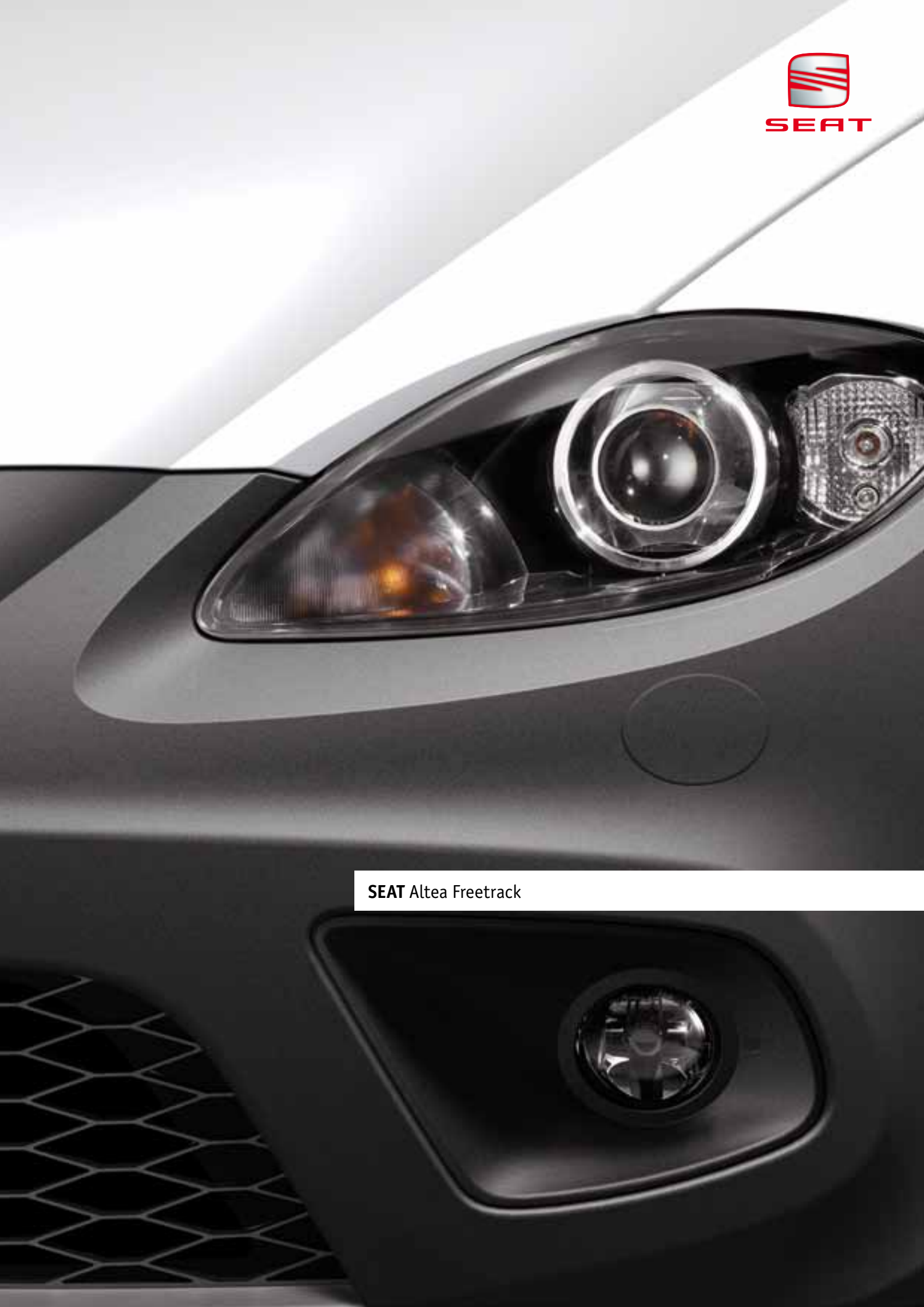
SEAT Altea Freetrack