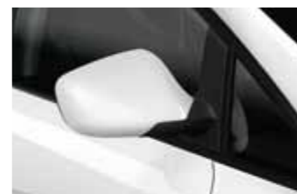
БЕЛЫЙ (White - B4B4)