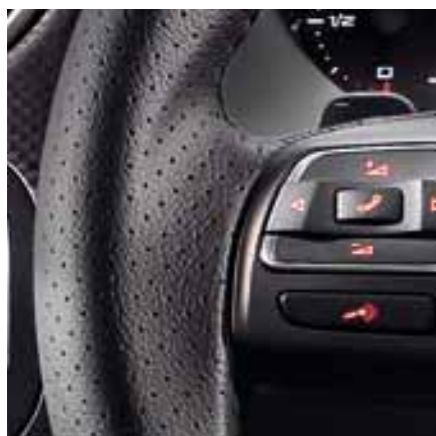
Многофункциональное рулевое колесо с кожаной отделкой.