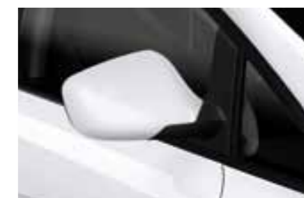
БЕЛЫЙ (Nevada White - 2Y2Y) с эффектом металлик