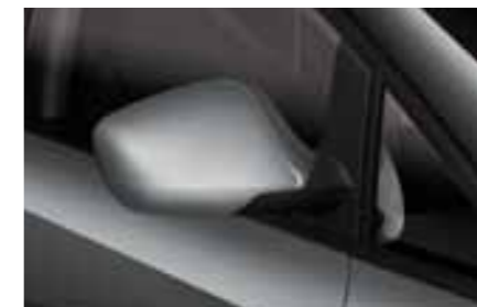
СЕРЫЙ (Pirineos Grey - 0C0C) с эффектом металлик