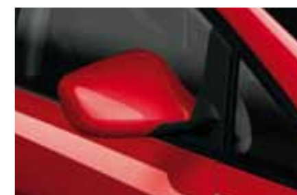
КРАСНЫЙ (Emocion Red - 9M9M)