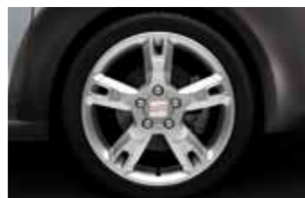
17" Легкосплавный диск "Copector" (для версии с полным приводом 4WD)