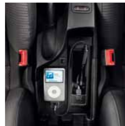
Оборудование для подключения iPod** и разъемы USB/AUX-in (CUP), для воспроизведения формата MP3.