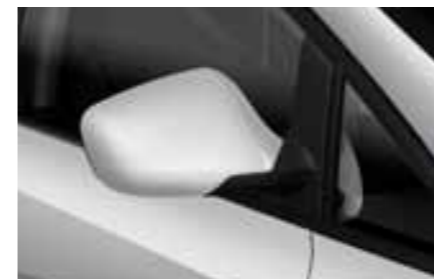
СЕРЕБРИСТЫЙ (Estrella Silver - P5P5) с эффектом металлик