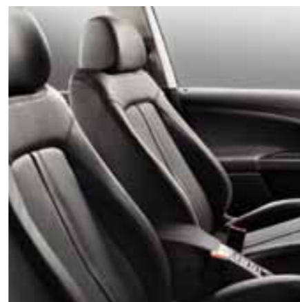
Сиденья с кожаной обивкой (опциональное оборудование)**